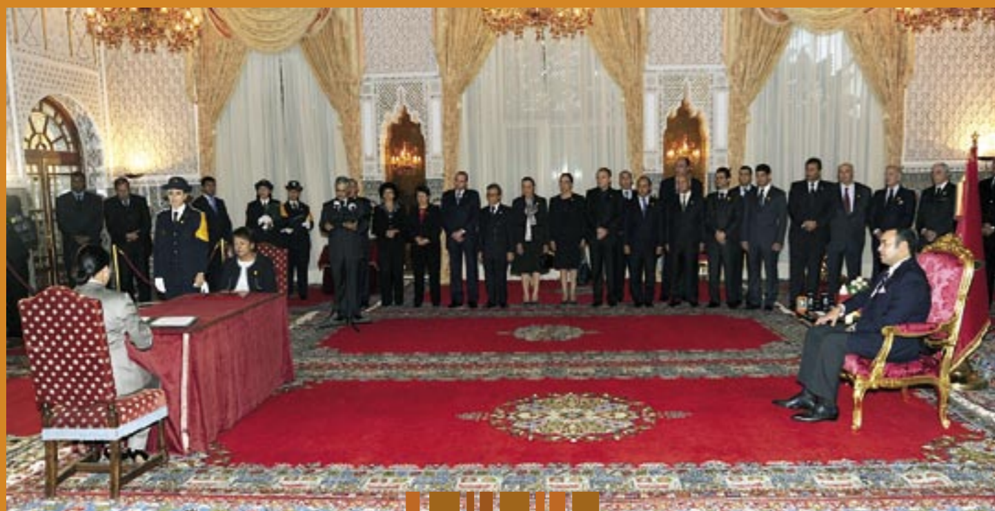
.Sa Majesté le Roi Mohammed VI préside à Agadir la cérémonie de transfert de projets de la Fondation Mohammed V pour la Solidarité à l'État

La Fondation initie, finance, motive et transfère la gestion de tous les projets qu'elle réalise.