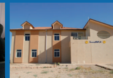
Foyer de jeunes Filles - Tanante