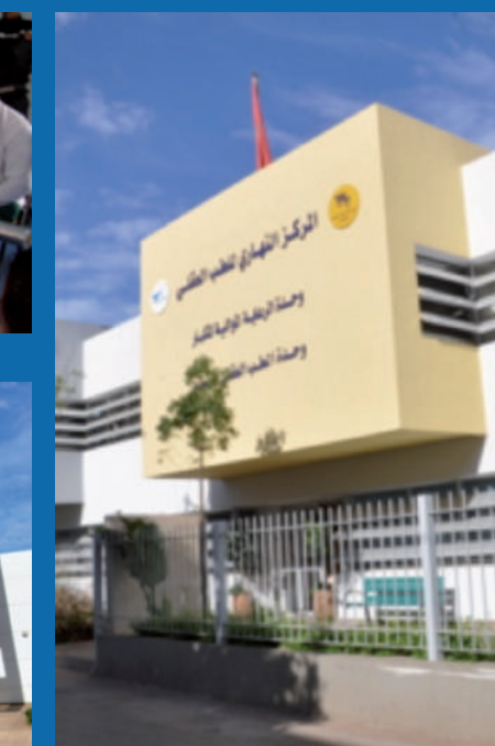
Centre du jour de gériatrie psychiatrique - Hôpital Ar-Razi, Salé