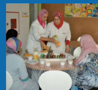
DAR AL OUM - CHU Ibn Rochd - Casablanca