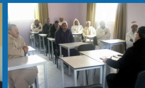
Centre de développement agricole - Laajajra Abed