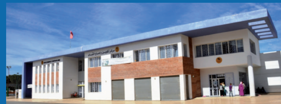
Centre d'insertion professionnelle des jeunes - Bouknadel, Salé