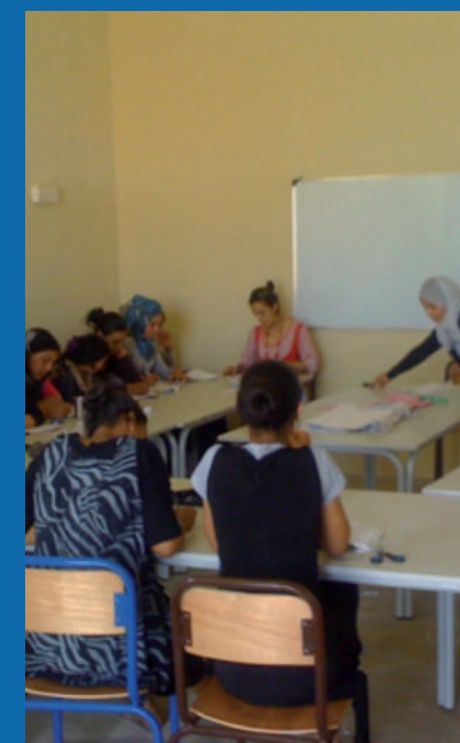
Centre de développement rural - Ait Ikko-Ait Mimoun