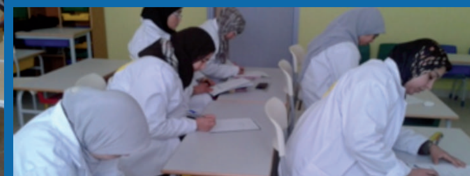
Centre de formation et de renforcement des compétences des femmes - Toulal