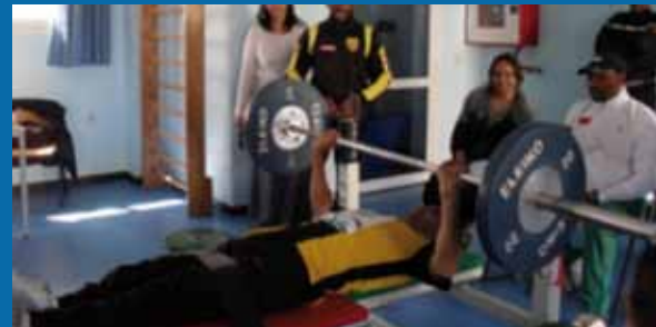
المركز الاجتماعي الرياضي وتكوين الشباب - عين النقيبي