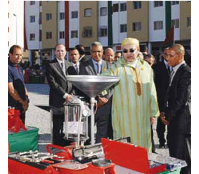
• 80 مشروعا وبرنامجا اجتماعيا سنة 2013 • 73 قافلة طبية في 42 إقليما بالمملكة

هذه المبادرة التي تأتي لتعزز أصرة التضامن التي جاءت بها الدورة 16 للحملة الوطنية للتضامن وتؤكد مرة أخرى أهمية تشجيع التشغيل الذاتي وكذا إرادة المؤسسة في ضمان اندماج اجتماعي ومهني أفضل للشباب المنحدرين من عائلات معوزة.