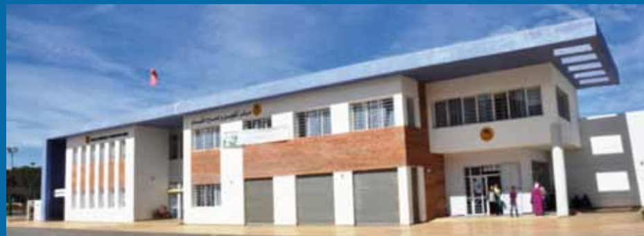
المركز النهاري لطب الشيخوخة والطب العقلي - مستشفى الرازي، سلا