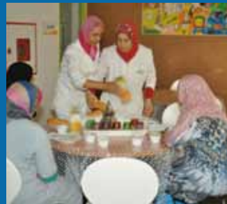
دار الأم - المركز الاستشفائي الجامعي بن رشد