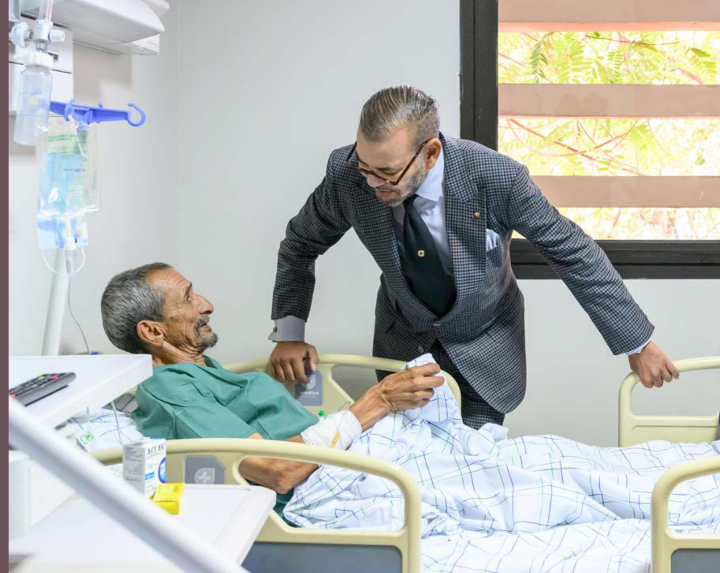
Sa Majesté le Roi Mohammed VI, au chevet des blessés du séisme au CHU de Marrakech - 12 septembre 2023

La nuit du 8 au 9 septembre, le Maroc est touché par un tremblement de terre de grande ampleur, ayant engendré des dégâts matériels et des pertes humaines sans précédent dans les provinces Al Haouz, Chichaoua, Taroudant et à Marrakech. Dans ce moment de crise, le leadership de Sa Majesté Le Roi Mohammed VI, que Dieu L'assiste , a été crucial dans l'activation d'une réponse immédiate, organisée et structurée pour faire face à cette catastrophe naturelle. Une mobilisation nationale générale, portée par l'ensemble des corps de l'Etat, de l'Armée et de la Fondation, pleinement investie dans sa mission humanitaire, a été mise en œuvre pour apporter les premiers secours, protéger les populations vulnérables et fournir les aides d'urgence aux foyers touchés par le séisme - soit plus de 2,8 millions d'individus.