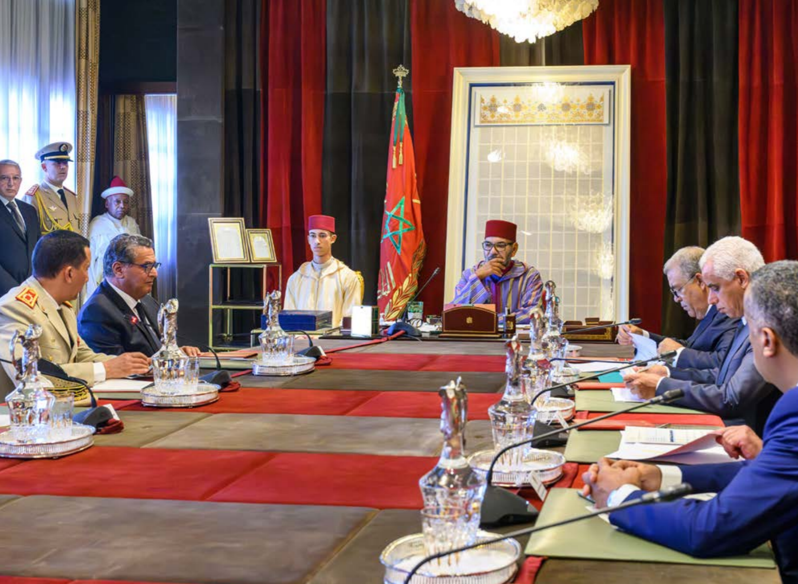
Sa Majesté le Roi Mohammed VI, présidant une séance de travail consacrée à l'examen de la situation - 9 septembre 2023